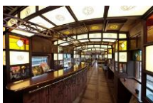
※三角駅から徒歩3分で発船場へ