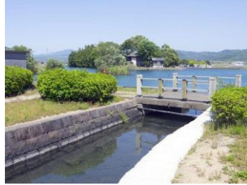
浮島神社と浮島周辺水辺公園

1日当りの湧水量がなんと13万トン。浮島熊野座神社が池に浮かんでいるように見えることから「浮島さん」の愛称で知られている神社。一帯は水辺公園となっており、町民の憩いの場になっています。嘉島町は生活用水が全て地下水で賄われている全国でもあまり類をみない町です。