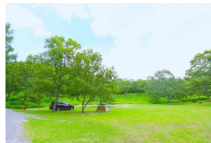
車横付けOKの広々としたサイト