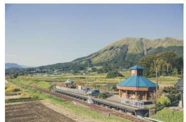
2020年3月まで日本一長い駅名だった「南阿蘇水の生まれる里白水高原駅」

現在は中松⇄高森間5駅7.1Kmの部分営業ですが、2023年の全線復旧に向け再開準備中です。平日は3往復、土日祝日は普通列車1往復+トロッコ列車4往復で運行しています。全線再開は2023年夏を予定しています。※12月～2月はトロッコ列車運休。平日と同じ運行となります。 (問) 南阿蘇鉄道 0967-62-0058