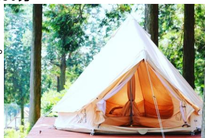
フリースペースではマイテントを設置可能