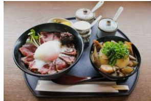
あか牛丼とだご汁