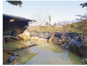
南外輪山が一望できる 栃木温泉

栃木温泉では南外輪山が一望でき、原生林の静かな癒しを満喫できます。垂玉温泉には北原白秋や与謝野鉄幹らが訪れその風情を称えました。湯治場として親しまれてきた地獄温泉は混浴の「すずめの湯」をはじめ5つのお湯が施設に点在。一つ一つが個性豊かな南阿蘇温泉郷で、湯巡りをしませんか。 (問) 南阿蘇村温泉旅館組合 0967-67-2226