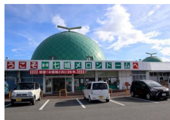
道の駅 七城メロンドーム