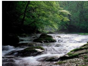
春の若葉の美しい菊池溪谷