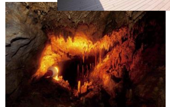
「幸せの鐘」が設置されている「球泉洞テラス」と球泉洞内部