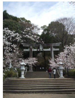
桜の花が咲き誇る菊池神社