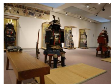
手ぶらでOK「甲冑着付け体験」