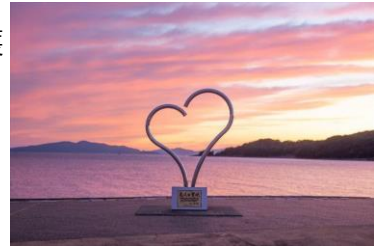
マジックアワーのロマンティックな恋人の聖地